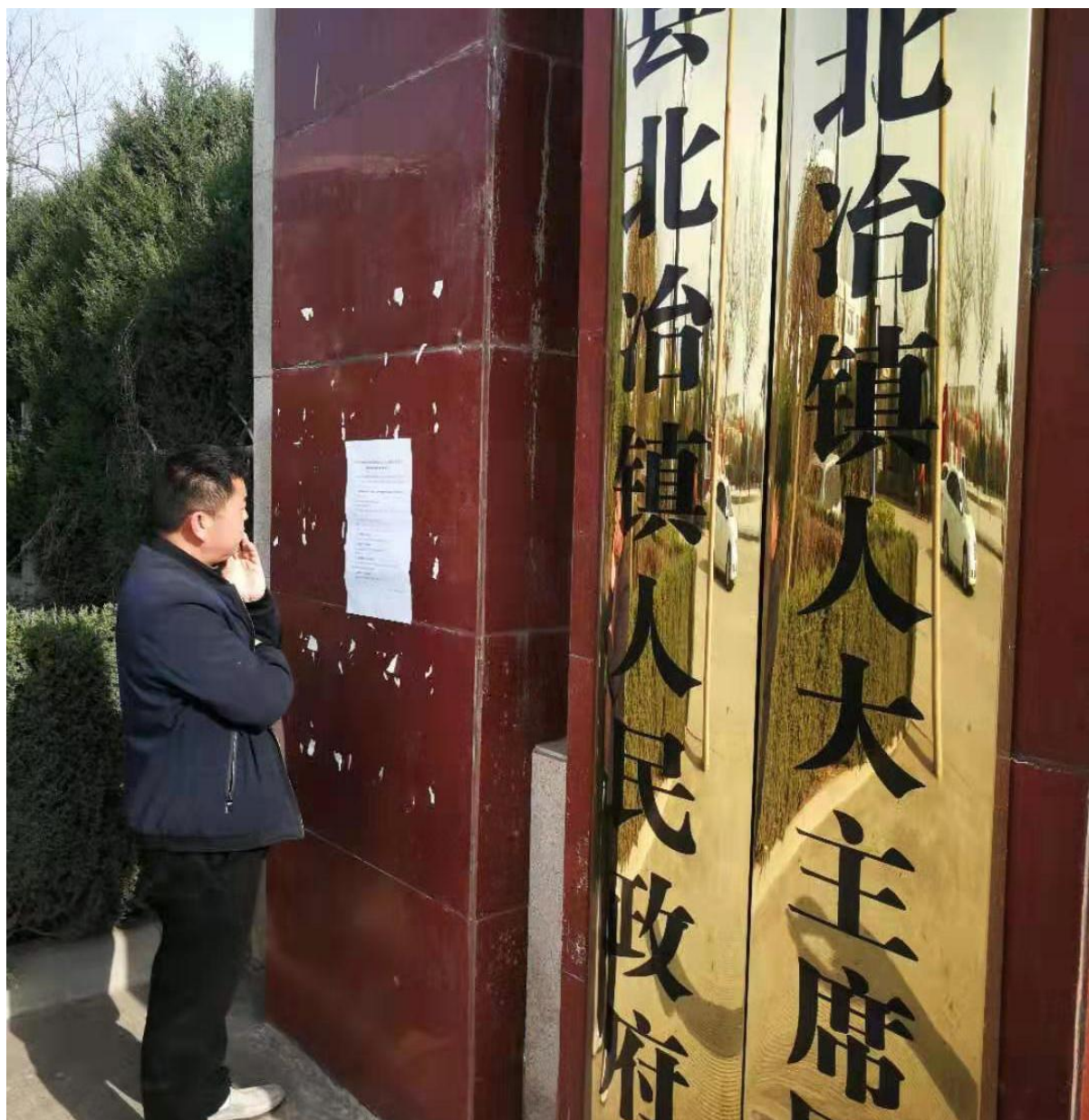
图 6 公众参与第二次公示（北冶镇张贴公告）