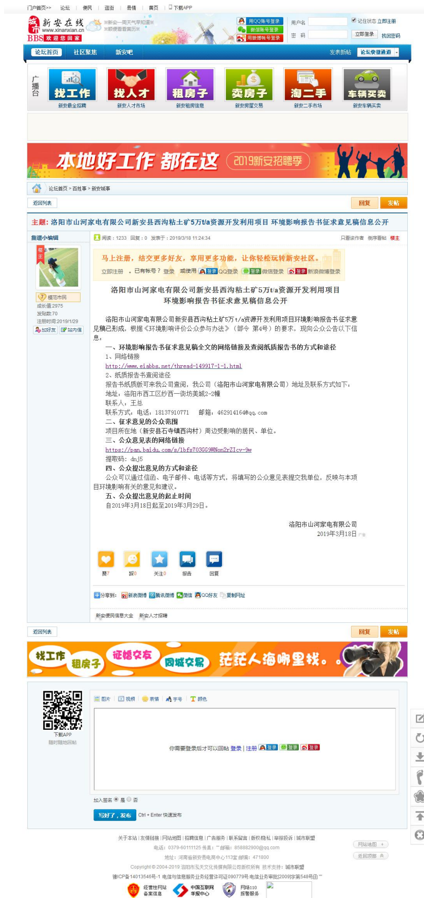
图 2 公众参与第二次公示（新安在线网页截图）