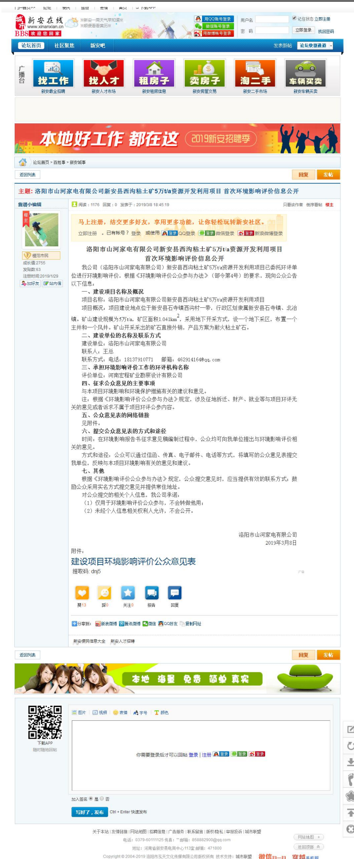
图 1 公众参与第一次公示 (网页截图)